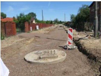
Przebudowa ulicy Pustej w Prabutach