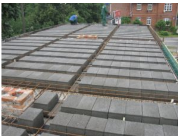
Przebudowa budynku MKS Pogoń – etap I

Wymiana nawierzchni ulicy Wołyńskiej w Prabutach