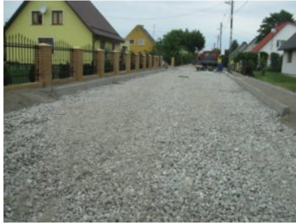
Wymiana nawierzchni ulicy Wołyńskiej w Prabutach