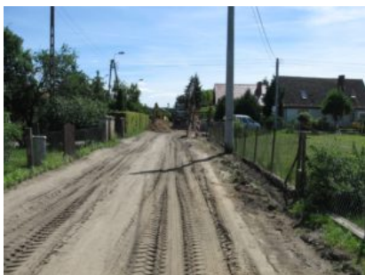
Przebudowa ulicy Pustej w Prabutach