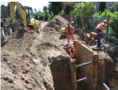
Przebudowa ulicy Pustej w Prabutach