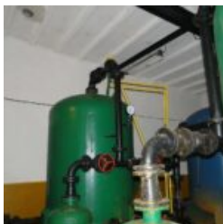
Foto przed inwestycją: